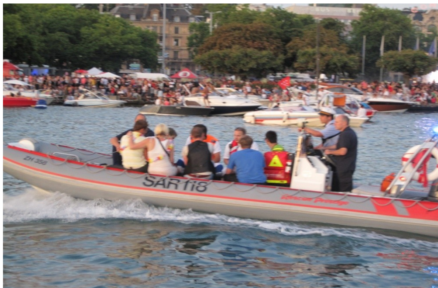
AIOLOS als Sanitätsschiff im Einsatz, Streetparade 2011