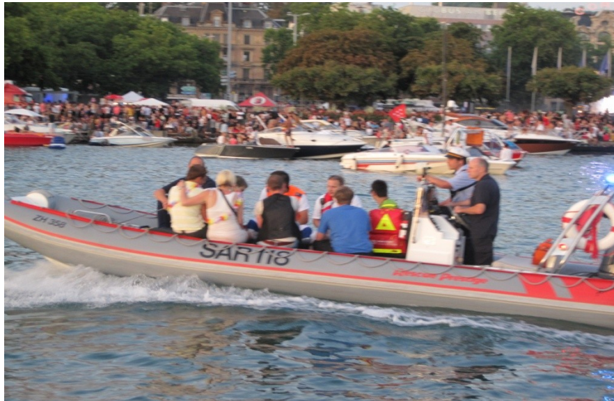
AIOLOS als Sanitätsschiff im Einsatz, Streetparade 2011