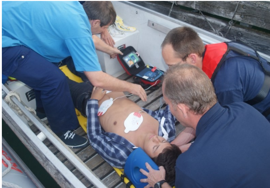
Üben mit dem Defibrillator